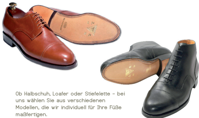
Ob Halbschuh, Loafer oder Stiefelette - bei uns wählen Sie aus verschiedenen Modellen, die wir individuell für Ihre Füße maßfertigen.

Hochwertige Schuhe in Maßanfertigung müssen nicht teuer sein - zumindest nicht bei uns. Denn wir haben das Wort "Laufzeit" für unsere Kunden neu definiert. So sind unsere Maßschuhe doppelt bequem. Bequem zu tragen und bequem zu finanzieren. Bei uns können Sie Ihre neuen Schuhe einfach und problemlos in kleinen Schritten zahlen. Mit unseren maßgeschneiderten Finanzierungsangeboten erhalten Sie bei uns Ihr handgefertigtes Paar Schuhe schon für weniger als 20 Euro im Monat. Und wie es sich beim Leasing gehört, nehmen wir Ihre Schuhe (gemäß vereinbartem Restwert) zurück - garantiert!